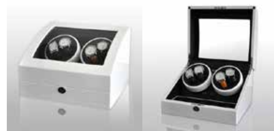
Vit/Svart #102021 Pris 3 995 kr