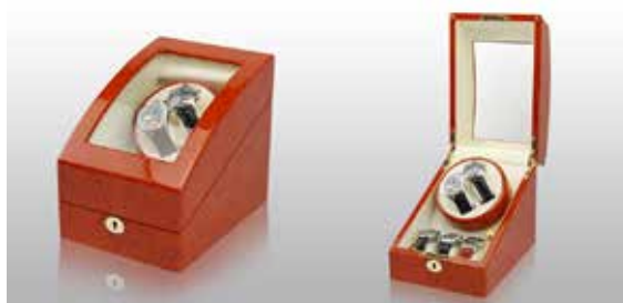
Brunt trä/Vit #101032