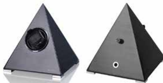
Carbon #251088 Pris 3 895 kr