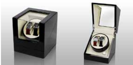
Svart/Vit #111012 Pris 2 795 kr