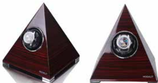
Mörkbrun #251068 Pris 3 695 kr