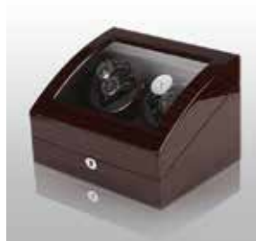
Mörkbrun/Svart #102061 Pris 3 995 kr