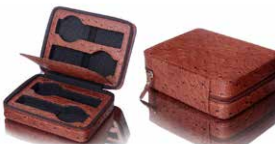
Etui för 4 klockor