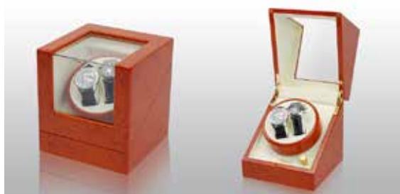
Brunt trä/Vit #111032 Pris 2 795 kr