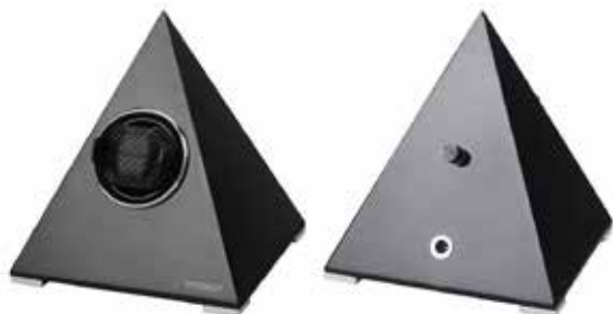
Svart #251011 Pris 3 495 kr