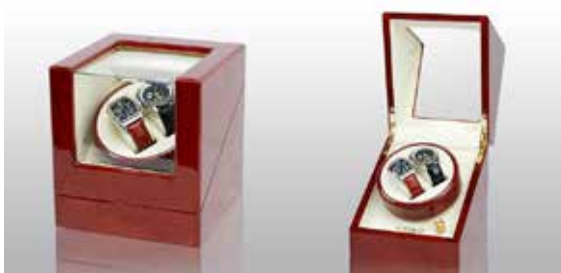
Rött trä/Vit #111042 Pris 2 795 kr