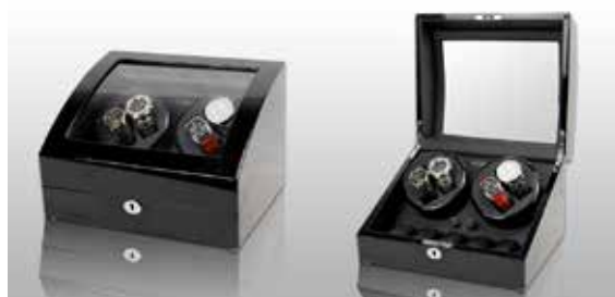
Svart/Svart #102011 Pris 3 995 kr