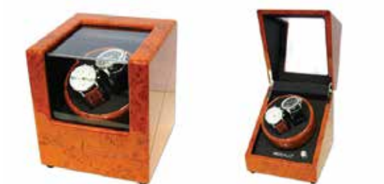
Brunt trä/Svart #111031 Pris 2 795 kr