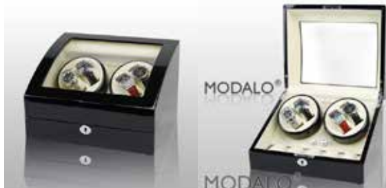
Svart/Vit #102012 Pris 3 995 kr