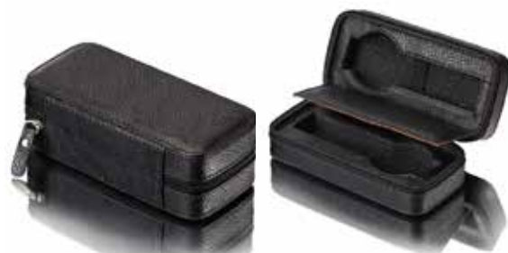
Etui för 2 klockor