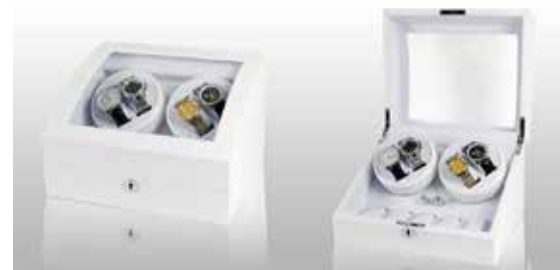
Vit/Vit #102023 Pris 3 995 kr