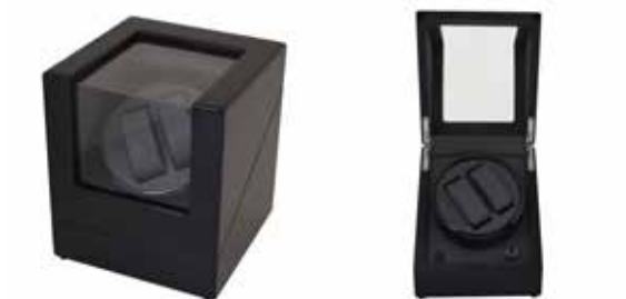
Svart/Svart #111016 Pris 2 795 kr