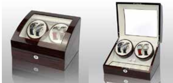
Mörkbrun/Vit #102062 Pris 3 995 kr