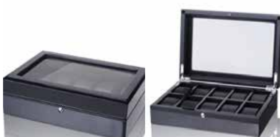
Förvaringsbox för 10 klockor