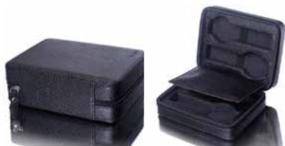
Etui för 4 klockor