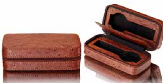
Etui för 2 klockor