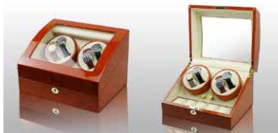
Brun trä/Vit #102032 Pris 3 995 kr