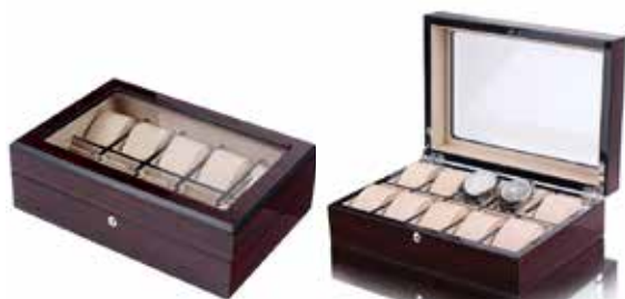
Förvaringsbox för 10 klockor