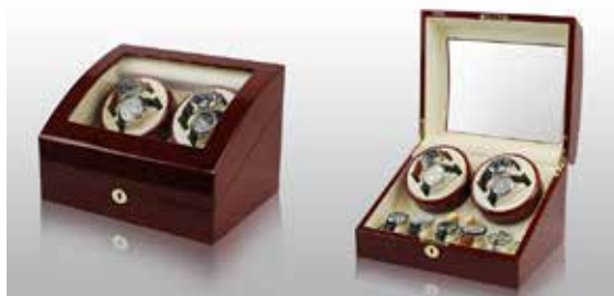
Rött trä/Vit #102042 Pris 3 995 kr