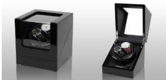
Svart/Svart #111011 Pris 2 795 kr